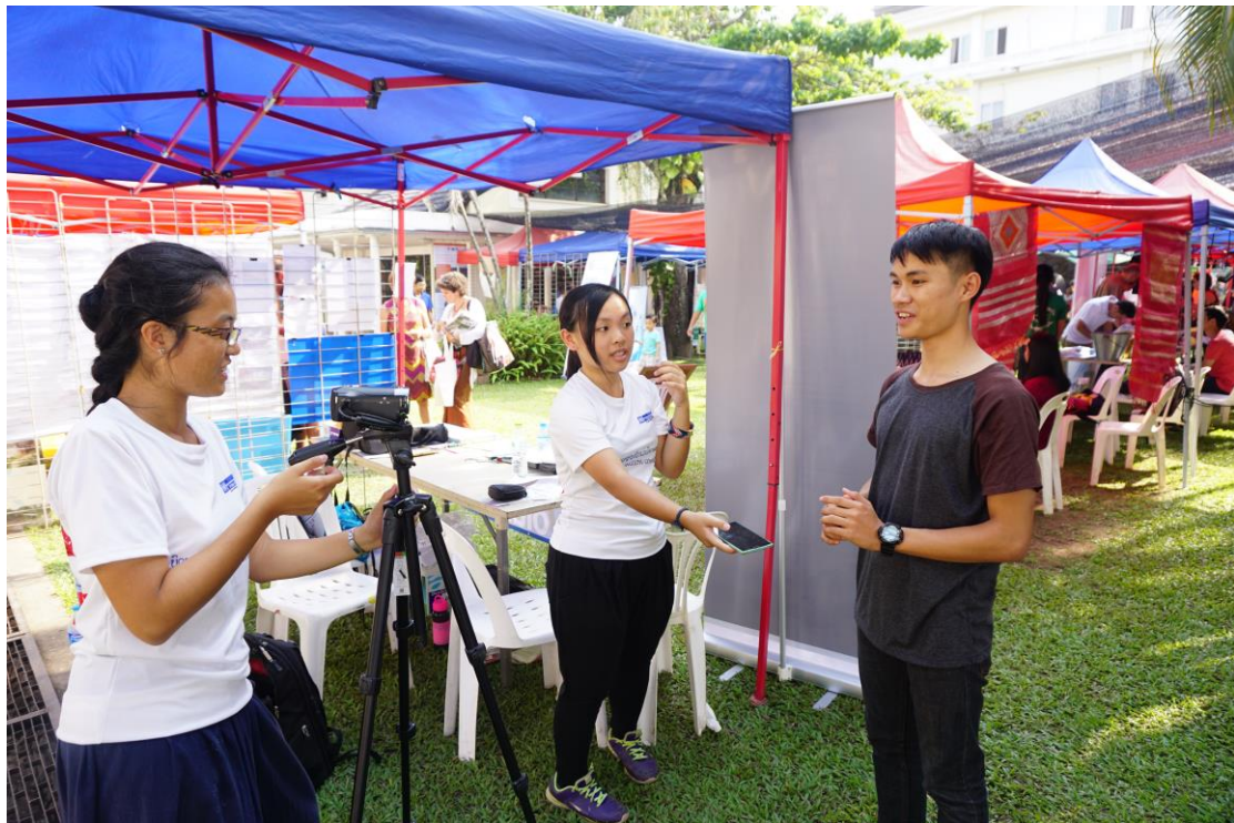
訪問當地青少年，搜集他們的義工故事

到有一次他聽見我們這些年輕 UNVs 快要完成幾個月的 assignments 要離開了，才發現我們都沒怎麼聊天過，所以便特意約我們吃飯。他分享了他在 UN 工作多年的感受，也談及聯合國其中一樣最為人所垢病的是 Security Council 的政治限制，這是他不得不承認的。但他認為 UN 的政治層面跟發展層面不同，也就是說，UNDP 確確切切地在發展中國家做了不少貢獻，這是無容置疑的，也是他繼續留在 UN 工作多年的原因。那次對話後，對聯合國這個名字，又有深一點點的體會。