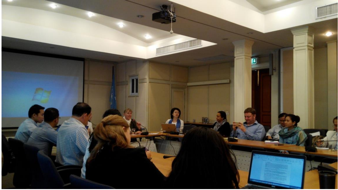
與不同 UN agencies 的員工參與 UNDP 的會議