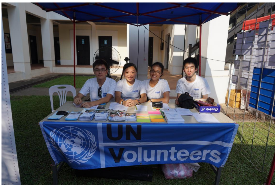
擺攤位推廣義工文化及招募UNV

那麼我在聯合國裡的實際工作是甚麼呢？我的assignment title是 UNV in Support to Communications，主要協助UNV Office的運作，實際的工作包括：做Research研究當地人參與義工的程度、設計Social media campaign 或擺Booth鼓勵當地人做義工、訪問當地青少年做義工的故事和幫忙寫UNV面試的Report等。由於今年恰好是UN成立70週年、Lao PDR成立40週年和Lao PDR加入聯合國60週年，所以我還會協助UNDP一連串的慶祝活動和推廣今年確立的SDGs (Sustainable Development Goals)。