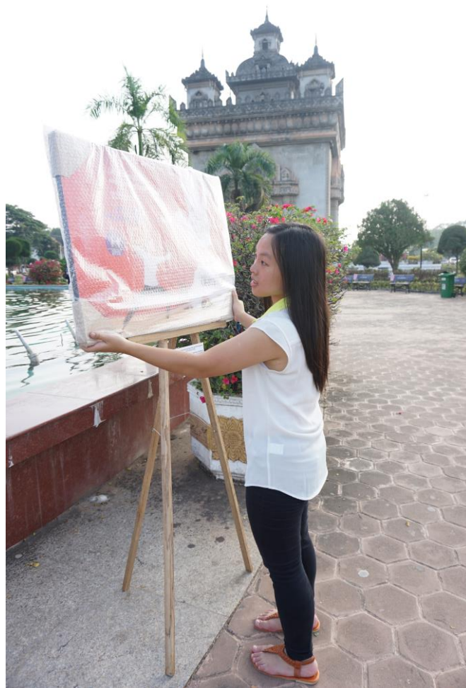
在為 UN 70 週年的攝影展覽作準備